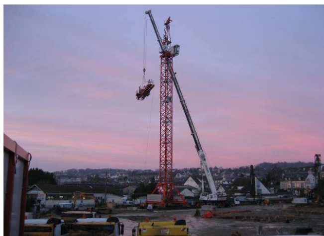
Le montage de la grue à tour.