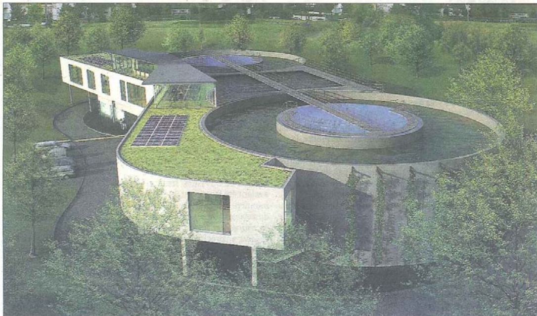
Le nouveau bâtiment de traitement des boues devrait être opérationnel à partir de mars 2010.

L'accès au chantier se fera par le chemin du Roy et le chemin du Marais. Les horaires de travail seront de 7 heures à 20 heures.