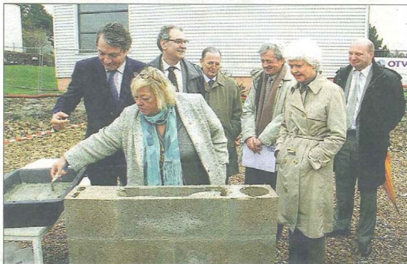
Les élus de la CdC, du Département et de la Région ont posé la première pierre samedi à Touques.

Le bâtiment sera construit dans une démarche Haute Qualité Environnementale privilégiant un confort acoustique (pompages couverts et immergés, insonorisation des locaux sensibles, etc...) et un confort olfactif. Sur ce second point, la conception du bâtiment devrait éviter l'évaporation des odeurs. Le projet prévoit également une